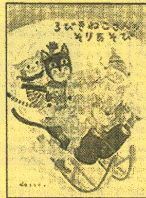
「3びきねこさんのそりあそび」 柳生まち子 作 2006年刊 福音館書店

絵本の絵の中には、おはなしの伏線や、作家のいたずらなど、様々な楽しみが隠れています。どうぞ、ごゆっくりお楽しみください。