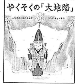
「やくそくの「大地踏」」 つちだよしはる 作 リーブル 2018年