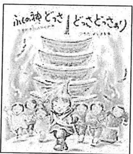
「ふくの神どっさ どっさどっさあり」 つちだよしはる 作 リーブル 2002年

そこで、今月の一冊は『やくそくの「大地踏」』(つちだよしはる作 リーブル 2018年刊)を紹介させていただきます。この絵本は、「えほん・こどものまつり」シリーズの一冊で、黒川能の王祇祭を題材にしています。大地踏は、王祇祭の一番初めに子どもが舞う大切な舞です。神の子となって大地を踏み固め悪いものを踏み鎮める舞であるとのこと。残念ながら私は、王祇祭に参加したことはありませんが、報道映像などで観る「大地踏」の子どもたちの様子は、本当にりっぱで、こんな小さな子