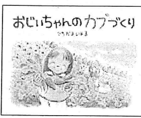
「おじいちゃんのカブづくり」 カブづくり つちだよしはる 作 そうえん社 2008年

子どもたちが担ってきたお祭りの継承が、難しくなっていることが言われて久しいですが、この絵本を読むことで、子どもの成長のために受け継がれてきた伝統文化の大切さを、あらためて感じました。ぜひ、原画をご覧いただくとともに、読んでいただきたい一冊です。